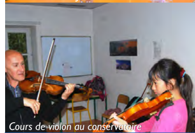
Cours de violon au conservatoire