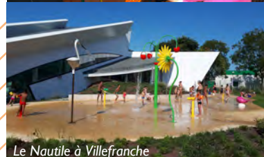
Le Nautilus à Villefranche