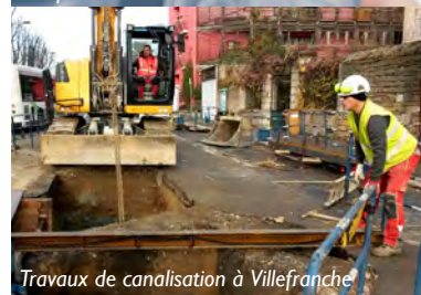
Travaux de canalisation à Villefranche